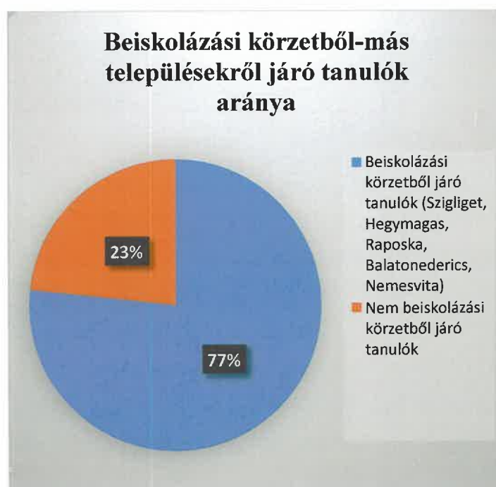
6. ábra Beiskolázási körzetből járó és más településekről érkező tanulók aránya a 2023/2024-es tanévben