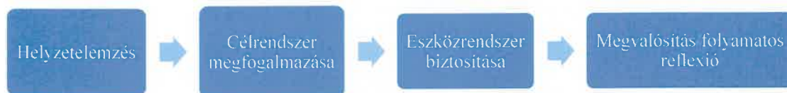
1. ábra Stratégiakészítés folyamatábrája