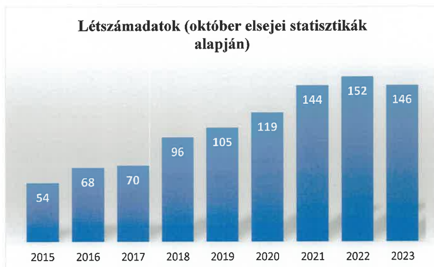
5. ábra Létszámadatok alakulása.